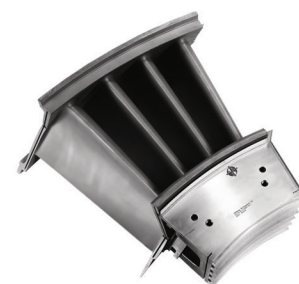
MGT40 - Nozzel Stage 3