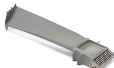
MGT40 - Bucket Stage 3