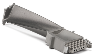
MGT40 - Bucket Stage 2