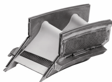
MGT40 - Nozzel Stage 1